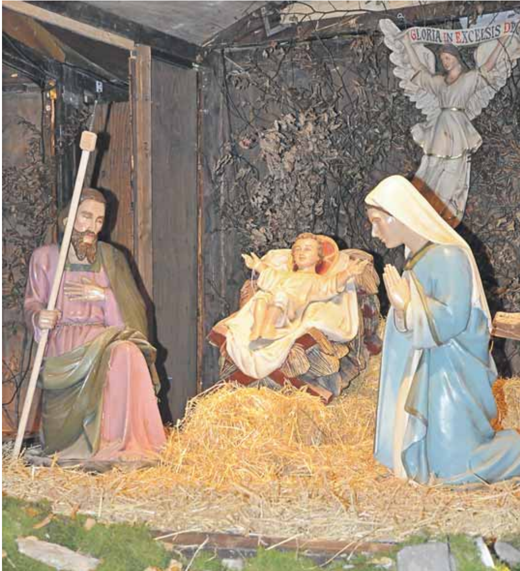
Eine lebensgroße Krippe ist Herz und Mittelpunkt des Marktplatzes.

Der Weihnachtsmarkt der Nationen in Rüdesheim am Rhein