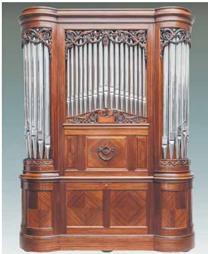
Selbstspielende Salon-Organ Philharmonie, Modell No. 4 von Welte und Söhne, Freiburg/Breisgau 1911/1912.

Auch in den unteren Gesellschaftsschichten hielt die mechanische Musik Einzug. Kleine Tonzungenorgeln mit gelochten Pappscheiben waren schon für ein paar Mark zu haben und somit für jedermann erschwinglich. Auch