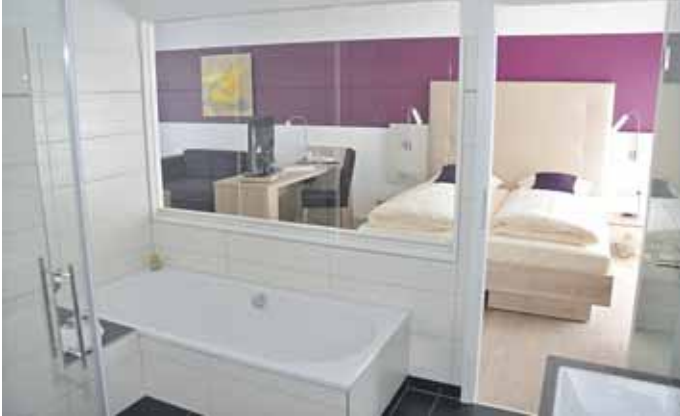
Brühl's Hotel Trapp

Brühl's Hotel Trapp: Ein Traum von luxuriösem Urlaub. In der dritten Etage des Hotels in Rüdesheim sind nach umfangreichen Ausbaurbeiten zwei Juniorsuiten und vier Deluxe Doppelzimmer mit Blick auf das Rheintal oder auf die „Germania“ und die Weinberge entstanden. Damit verfügt das für sein besonderes Ambiente bekannte Hotel in der Altstadt über beste Voraussetzungen, seinen Gästen einen Rüdesheim-Aufenthalt auf ganz besondere Art und Weise erleben zu lassen. Hier darf man sich wohlfühlen, wie zu Hause. Eine gute Adresse, wie geschaffen für Urlaub und Lebensfreude pur. Jeder Tag voll schöner Erlebnisse, die an Rüdesheim am Rhein und das freundliche Brühl's Hotel Trapp noch lange erinnern.