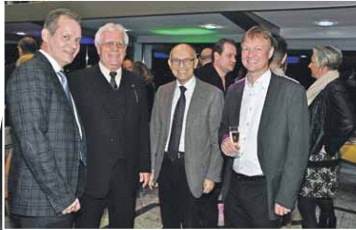
Zahlreiche Gratulanten kamen auf das Fahrgastschiff „Rhenus“ um ...