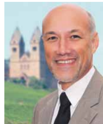
Volker Mosler Bürgermeister der Stadt Rüdesheim am Rhein

Auch dem diesjährigen „Weihnachtmarkt der Nationen“ mit seinen vielen Besuchern wünsche ich einen erfolgreichen Verlauf.