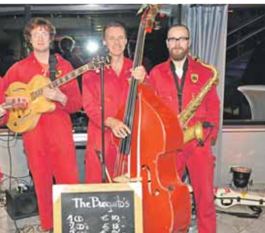
... „The Busquitos“.