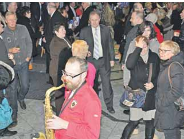
Für Unterhaltung sorgten ...