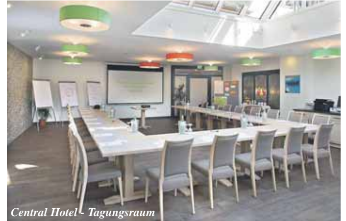
Central Hotel - Tagungsraum

13.3.2015 Classic Clash: Konzert mit Konzertpianist Detlev Bender. Eröffnung der neuen Konzertreihe im „Musikalischen Wintergarten“. Anschließendes Diner in Anwesenheit des Künstlers. 59 Euro pro Person, Konzertbeginn 19.30 Uhr. Weitere Informationen unter: www.centralhotel.net oder rufen Sie an: 06722-9120. Für alle Veranstaltungen werden auch Geschenkgutscheine ausgestellt.