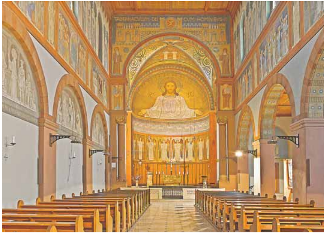
Abtei St. Hildegard, Wandbilder zeigen das Leben und Wirken Hildegards.

Weg mit prägnantem Symbol der Hildegard von Bingen